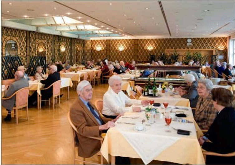
▲ Gut besucht: Der Speisesaal im „Konviktsgaard“ ist besonders mittags ein beliebter Treffpunkt

Bis zu 120 Bewohner können im „Konviktsgaard“, der von der Sodexho-Gruppe im Rahmen einer jährlich erneuerten Konvention mit der Stadt Luxemburg geführt wird, eine Bleibe finden. Mit 45 Studios à 39 qm, 13 rollstuhlgerechten Studios, 45 Appartements (24 à 54 qm, 21 à 49 qm) sowie acht möblierten Studios für Kurzaufenthalte verfügt die Einrichtung über großzügige Kapazitäten. Besonders gefragt sind letztgenannte Räumlichkeiten, die alten Menschen z.B. nach einem Klinikaufenthalt über die Rekonvaleszenzzeit helfen oder eine Unterkunft bieten, wenn pflegende Angehörige in Urlaub sind. Zwei Krankenschwestern, vier „aide-soignantes“, neun „aide-socio-familiale“-Kräfte (ASF) sowie Mitarbeiter von „Hëllef doheem“ decken den betreuenden Bedarf ab, ohne dass das Haus den Eindruck einer klassischen Altenpflegeeinrichtung widerspiegelt.