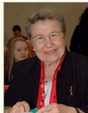
▲ Prof. Dr. Dr. hc. Ursula Lehr ist Gastrednerin des diesjährigen Symposiums der RBS-Seniorenakademie

► Weitere Informationen erhalten Sie beim Service RBS unter Tel. (+352) 36 04 78 21